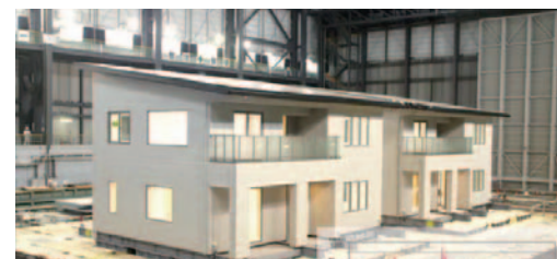
世界最大規模の実験施設「E-ディフェンス」

最先端の実験設備「E-ディフェンス」での実大実験の回数は業界最多。その強さは、防犯拠点となる消防署や警察と同じ、最高等級の「耐震等級3」。優れた耐震性で、もしもの時も安心です。