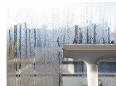
断熱不足による窓の結露

外気温の影響を受けにくい高性能樹脂枠に加え、断熱性能の高い特殊な金属膜をコーティングした2枚の「Low-E ガラス」と高い強度の「防犯合わせガラス」という3層構造。断熱による省エネ性と、防犯性能による安心を兼ね備えた窓です。