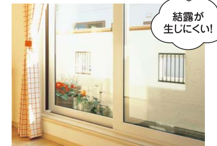
一条のトリプル窓